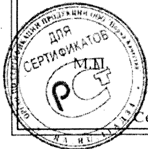
Схема сертификации: 1