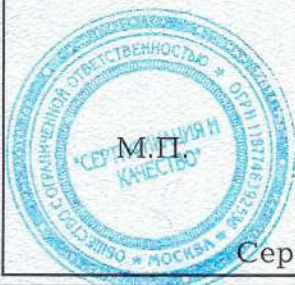
Схема сертификации: 1с.