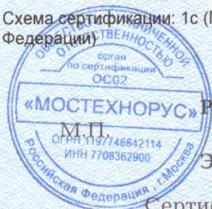
Схема сертификации: 1с (ГОСТ Р 53603-2020 Оценка соответствия. Схемы сертификации продукции в Российской Федерации)